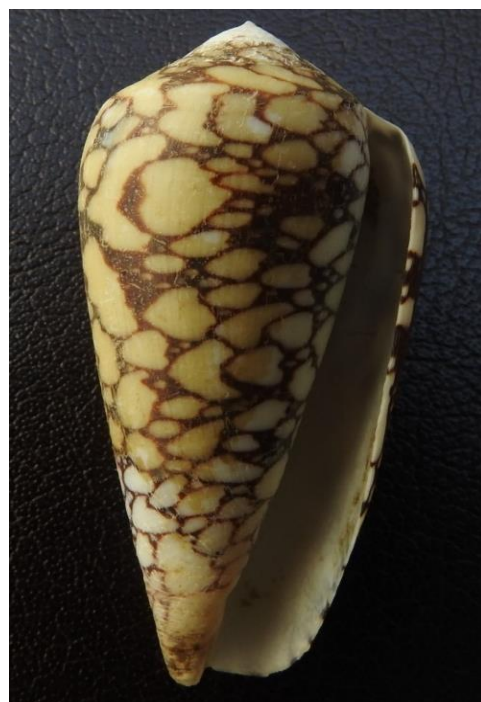
شکل-۴. نمایی از صدف مخروطی پرماتند جمع‌آوری شده از جنوب جزیره قشم.