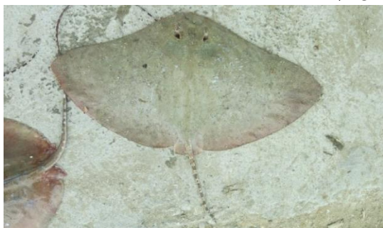
شکل-۶. سفره‌ماهی گزنده از خانواده سفره‌ماهیان پروانه‌ای.

سفره‌ماهی‌های پروانه‌ای در آب‌های گرم اقیانوسی سراسر جهان همانند خلیج فارس مشاهده می‌شوند و بر اساس بدن صفحه مانندشان که از دو طرف بسیار کشیده شده شناخته می‌شوند (شکل-۶).