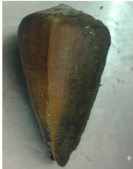
شکل-۳. نمایی از صدف مخروطی فریجید جمع‌آوری شده از جنوب جزیره قشم.

در مجموع ۱۳ عدد از این گونه در سواحل صخره‌ای-ماسه‌ای جنوب جزیره قشم رویت شد (۱۲ عدد فصل سرد و یک عدد فصل گرم). این تعداد نمونه ۲۸٪ کل نمونه‌های مربوط به صدف‌های مخروطی در منطقه مورد مطالعه را تشکیل می‌داد. نتایج مقایسه آماری نشان‌دهنده تراکم بیشتر این گونه در فصل سرد است ( P=0.001 ).