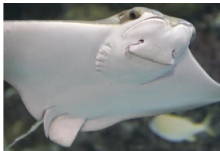
شکل-۷. سفره‌ماهی گزنده از خانواده سفره‌ماهیان پوزه‌گاوی صید شده بوسیله تله‌های صیادی در شمال جزیره قشم.

اعضای خانواده سفره‌ماهی‌های پوزه گاوی از سفره‌ماهیان گزنده با سر بزرگ و مشخص و بدن صفحه‌مانند با باله‌هایی که به سمت انتهای بدن خمیده شده‌اند شناخته می‌شوند (شکل-۷).