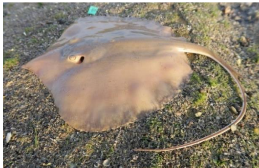
شکل-۵. سفره‌ماهی گزنده گونه راندالی ( Himantura randalli ) از خانواده سفره‌ماهیان دم شلاقی.

اعضای این خانواده سفره‌ماهی‌های دم‌شلاقی با ۹ جنس و حدود ۷۰ گونه در تمامی آب‌های اقیانوسی نواحی گرمسیری و نیمه‌گرمسیری از جمله آب‌های ایرانی خلیج فارس زندگی می‌کنند و از روی بدن صفحه مانند به شکل لوزی با نوک تیز شناخته می‌شوند (شکل-۵).