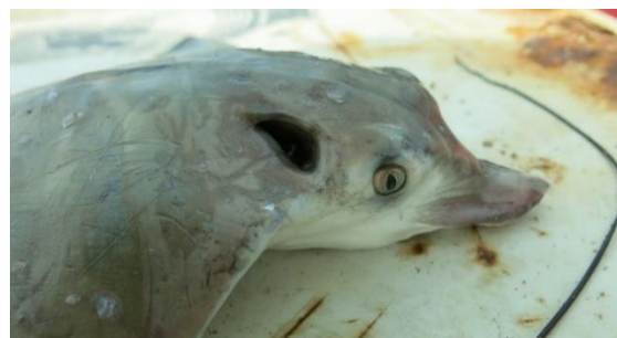
شکل-۸. سفره‌ماهی گزنده از خانواده سفره‌ماهیان پروانه‌ای، صید شده بوسیله تور ترال در شمال جزیره قشم.

بدن کشیده و داشتن پوزه کشیده از ویژگی‌های بارز سفره- ماهی‌های عقابی است (شکل-۸). آنها بیشتر در دریا شنا می‌کنند تا اینکه در بستر و زیر ماسه‌ها مخفی شوند.