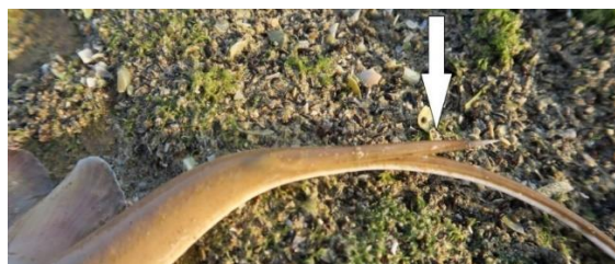
شکل-۱۰. نمایی از خار دمی (Sting) در سفره ماهی گزنده دم شلاقی گونه راندالی صید شده از جنوب جزیره قشم.