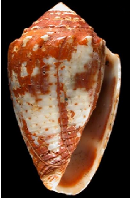
شکل-۲. صدف مخروطی تاج مانند در جنوب جزیره قشم.

مطالعه را تشکیل می‌داد و لذا می‌توان گفت صدف مخروطی تاج‌دار فراوان‌ترین گونه از جنس کونوس در منطقه است. نتایج مقایسه آماری نشان دهنده تراکم بیشتر این گونه در فصل سرد است ( P=0.001 ).