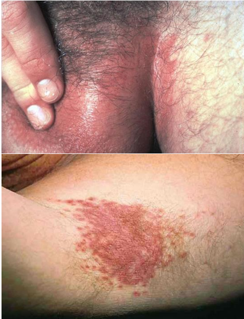
شکل-۸. عفونت کاندیدیازیس در کشاله ران (بال) و زیر بغل (پایین).

کاندیدیازیس جلدی یک مشکل شایع است. در این راستا باید بر روی کاهش فاکتورهای مستعدکننده در حد امکان تمرکز گردد. خشک کردن کامل نواحی آلوده و پرهیز از ساییدگی به پیشگیری از عود بیماری کمک خواهد کرد (۳۳،۳۴).