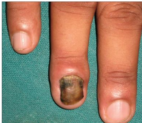
شکل-۱۰. درگیری ناخن ناشی از قارچ کاندیدا که باعث تغییر رنگ، تغییر فرم و التهاب در اطراف ناخن شده است.

عفونت ناشی از گونه های کاندیدا ممکن است محدود به دهان، گلو، پوست، انگشتان، ناخن ها، ریه یا دستگاه گوارش بوده و یا بصورت سیستمیک کل بدن را درگیر کند. از آنجایی که این قارچ بصورت طبیعی بر روی پوست، زیر ناخن ها، سطوح مخاطی همچون دهان، دستگاه گوارش و ... وجود دارد معمولاً از خود فرد منشا گرفته و از محیط اطراف کسب نمی شود. عوامل متعددی در بیماری زا شدن این قارچ ها نقش دارند که از جمله آنها می توان به افزایش سن اشاره کرد. با افزایش سن معمولاً افراد مستعد ابتلا به عفونت های قارچی کاندیدیایی می شوند. بعلاوه استفاده طولانی مدت از آنتی بیوتیک ها و معلولیت های عمومی و بیماری های ناتوان کننده نیز می توانند زمینه ساز بیماری باشند. شغل فرد عامل دیگری برای مستعد کردن افراد به بیماری است و کاندیدیازیس در رختشویان، ظرف شویان، میوه چینان، کنسروسازان، ماهی گیران، دریانوردان، پرسنل نیروی دریایی، نانوایان و هر شغل دیگری که در تماس زیاد با رطوبت باشد بیشتر دیده می شود. چاقی نیز باعث حساس شدن فرد به این بیماری می گردد (۳۰).