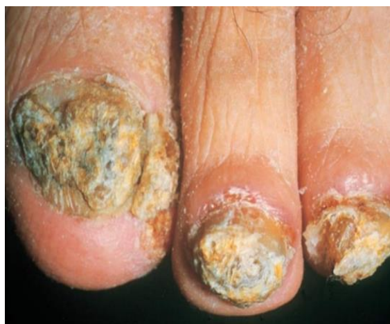
شکل-۷. کچلی ناخن در یک فرد

فرمی از مشکلات ناخن توسط دسته‌گیری از قارچ‌ها به نام ساپروفیت‌ها ایجاد می‌شود که در همه جا موجود هستند. انسان‌ها روزانه بطور مداوم در تماس با این قارچ‌ها هستند اما قدرت این قارچ‌ها در حدی نیست که بصورت مستقیم ایجاد مشکلات در ناخن‌ها کنند. در نتیجه وجود یک زمینه در فرد به بیماری‌زایی قارچ کمک می‌کند. این زمینه می‌تواند وارد شدن ضربه به ناخن باشد. این حالت به کرات در مبتلایان به قارچ ناخن مشاهده شده است. ضربه می‌تواند در اثر افتادن شیء سنگین بر روی ناخن و یا در اکثر موارد پوشیدن کفش تنگ ایجاد شود. پرسنل نظامی با توجه به فعالیت بدنی بالایی که دارند در صورتی که از کفش یا پوتین‌های مناسب استفاده نکنند به راحتی دچار ضربه به ناخن‌ها شده و به این ترتیب مستعد ابتلا به قارچ ناخن می‌شوند (۲۹).