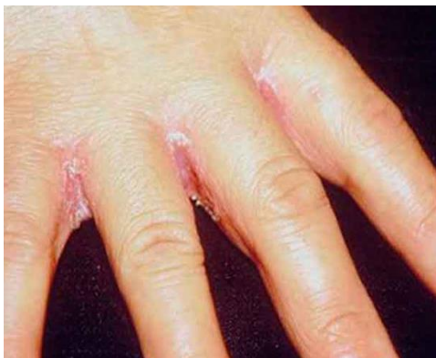
شکل-۹. کاندیدیازیس چین های بین انگشتی در دست که می تواند در اثر تماس مداوم دست با آب باشد.