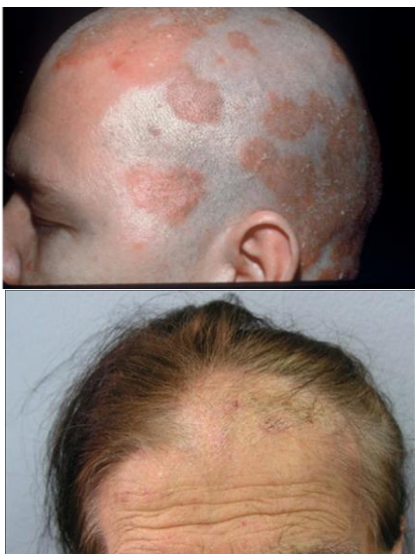
شکل-۱. کچلی سر در بزرگسالان که نواحی از پوست و موهای سر را درگیر کرده است.

کچلی سر عارضه قارچی پوست و موی سر، ابرو و مژه‌ها است. بیماری از حالت‌های خفیف پوسته‌دار و بدون علامت تا انواع شدید و ملتهب پوسته‌دار با ضایعات زخمی (Kerion) می‌تواند مشاهده شود. این بیماری به سه حالت ایجاد می‌شود که در متون قارچ شناسی از آنها تحت عنوان اندوتریکس، اکتوتریکس و فاووس یاد می‌شود. نکته قابل توجه در ارتباط با کچلی سر، این است که این بیماری معمولاً محدود به کودکان بوده و در بزرگسالان با شیوع خیلی کمتری مشاهده می‌شود (شکل-۱). اگر فردی در دوران قبل از بلوغ به کچلی سر مبتلا بوده و به درستی آن را درمان نکرده باشد احتمال باقی ماندن بیماری و خفیف شدن آن حتی در سنین بعد از بلوغ هم وجود دارد. علاوه بر این موارد، افرادی که در فعالیت‌های ورزشی همچون کشتی و باشگاه‌های بدنسازی مشارکت می‌کنند نیز امکان ابتلا به این بیماری را دارند. پس در صورت مشاهده هرگونه ضایعه در سر که دارای پوسته‌ریزی (شوره) و ریزش مو باشد می‌توان به کچلی سر مشکوک شد و برای تشخیص و درمان بیماری اقدام نمود. کچلی سر می‌تواند در ارتباط با عدم رعایت مناسب بهداشت فردی و همچنین استفاده مشترک از وسایلی همچون شانه، برس، کلاه باشد (۱۵).