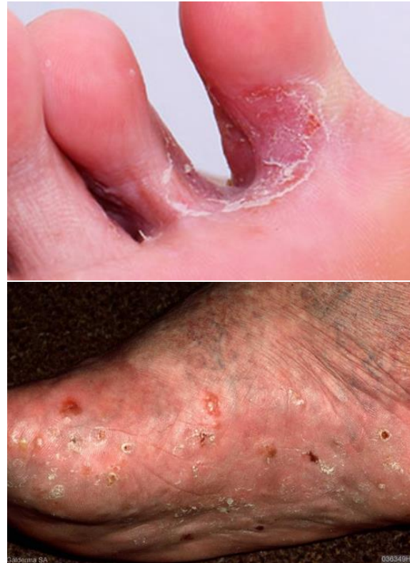
شکل-۴. کچلی پا: فرم بین انگشتی که معمولاً مزمن بوده و در فصل‌های گرم سال شدت پیدا می‌کند (بالا). فرم‌های شدیدتر کچلی پا (پایین).

بیماری کچلی پا انتشار جهانی دارد و روز به روز به فراوانی آن افزوده می‌شود. کچلی پا خاص مرحله بعد از بلوغ بوده و بیشتر در سنین ۱۹-۵۰ سالگی دیده می‌شود. این بیماری در مردان معمول‌تر از زنان است (۲۲، ۲۳).