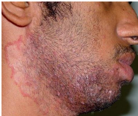
شکل-۵. ضایعات کچلی ریش که می‌تواند خفیف و یا شدید باشند.

کچلی ریش عفونت درماتوفیتی ناحیه مودار صورت و گردن است و بنابراین تنها در مردان بالغ دیده می‌شود (شکل-۵). این بیماری می‌تواند به دو فرم خفیف و شدید دیده شود (۲۶). کچلی ریش بیشتر در مناطق روستایی معمول بوده و از طریق تماس با حیوان آلوده نظیر گاو، گوسفند، گربه و غیره و یا از طریق تماس با فرد مبتلا ایجاد می‌گردد. در مواردی که موهای ناحیه نیز درگیر شده باشند، بیماری شدیدتر خواهد بود. در گذشته این بیماری شایع‌تر بود و دلیل عمده آن نیز آرایشگرها بودند که تیغ آلوده را برای افراد متعددی استفاده می‌کردند و به این ترتیب بیماری منتقل می‌شد. امروزه با استفاده از لوازم فردی، این بیماری کاهش چشمگیری داشته و دیگر شایع نمی‌باشد. در این بیماری نیز معمولاً ضایعات بصورت دایره‌ای است و در وسط آنها ریش موها اتفاق می‌افتد (۲۶).