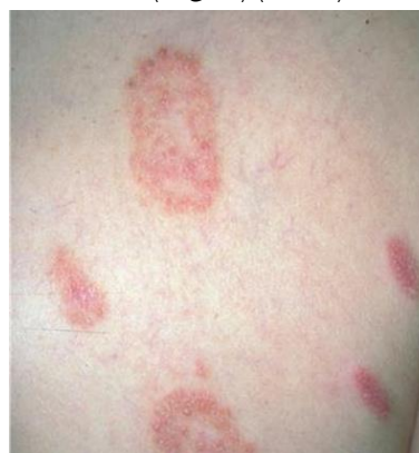
شکل-۲. کچلی بدن در قسمت پشت