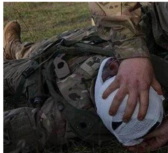
شکل-۱. آسیب تروماتیک مغزی در افراد نظامی

از گذشته تاکنون، افراد نظامی به علت برخورد شدید امواج ضربه‌ای ناشی از انفجار مهمات و همچنین نفوذ گلوله، در معرض آسیب تروماتیک مغزی (traumatic brain injury-TBI) بوده‌اند (شکل-۱). بیش از یک قرن قبل در مقاله‌ای در مجله معتبر لنست (سال ۱۹۱۵ میلادی) برای نخستین بار اثرات بالینی ناشی از شلیک گلوله و ضربه مغزی ناشی از آن توضیح داده شد (۱). در سال ۱۹۹۲ برای اولین بار اصطلاح "آسیب تروماتیک مغزی خفیف" ( mild traumatic brain injury) پدید آمد و در سال ۲۰۰۵ به طور رسمی توسط عموم به عنوان یک تشخیص قطعی اختلال روانی تروماتیک پذیرفته شد، و برای توصیف اثرات سلاح‌های انفجاری در سربازان آمریکایی در عراق و افغانستان استفاده گردید. در حال حاضر، TBI خفیف از نظر مفهومی شبیه به ضربه مغزی است، و TBI متوسط و شدید عمدتاً به آسیب نافذ مغز اشاره دارد. علاوه بر اینها، مفهوم انسفالوپاتی تروماتیک مزمن ( chronic traumatic encephalopathy-CTE) که برای اولین بار در سال ۱۹۵۷ در بوکسورهای حرفه‌ای گزارش شد؛ تظاهرات بالینی شبه دمانس، اختلال عملکرد عصبی عضلانی و روان‌پریشی دارد (۲،۳). علت‌شناسی، پاتوژن، تظاهرات بالینی و ویژگی‌های پاتولوژیک CTE شباهت زیادی با TBI نظامی دارد. در واقع، اگرچه همه ضربه‌های مغزی منجر به CTE نمی‌شوند و بسیاری از قربانیان در طول زمان بهبود می‌یابند، با این وجود اکثر موارد با CTE مداوم، سابقه ضربه‌های مغزی متعدد دارند (۴).