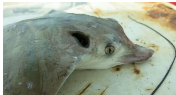
شکل-۸. سفره‌ماهی گزنده از خانواده سفره‌ماهیان پروانه‌ای، صید شده بوسیله تور ترال در شمال جزیره قشم.

بدن کشیده و داشتن پوزه کشیده از ویژگی‌های بارز سفره- ماهی‌های عقابی است (شکل-۸). آنها بیشتر در دریا شنا می‌کنند تا اینکه در بستر و زیر ماسه‌ها مخفی شوند.