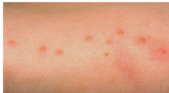
شکل-۳. محل گزش ساس به صورت منقطع (۴۳)

شستشوی محل گزش ساس و همچنین استفاده از آنتی‌بیوتیک‌ها برای ضدعفونی و از بین بردن باکتری‌هایی که روی زخم رشد می‌کنند، علاوه بر تسکین خارش، خطر ابتلا به عفونت پوستی ناشی از گزش را کاهش می‌دهد (۱۹). عمدتاً برای درمان علائم گزش ساس، استفاده از آنتی‌هیستامین‌های خوراکی، پمادهای موضعی و مراقبت‌های ویژه از زخم مفید خواهد بود (۴۱). علاوه بر این، استفاده کوتاه مدت از کورتیکواستروئیدهای خوراکی برای درمان تاول‌های پوستی توصیه شده است (۴۲).