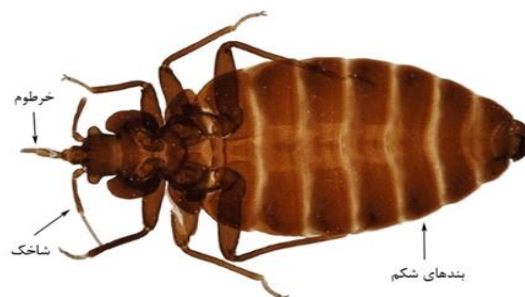
شکل-۲. حشره بالغ ساس تختخواب، تعداد بندهای شکم، شاخک و خرطوم (۳۲)

برای کنترل هر آفت، تشخیص و شناسایی آن، امری ضروری محسوب می‌گردد. تشخیص گونه‌های مختلف ساس با استفاده از روش‌های ریخت‌شناسی و مولکولی صورت می‌گیرد. استفاده از کلیدهای شناسایی که بر پایه تفاوت‌های ریخت‌شناسی در گونه‌ها بنا شده است از معمول‌ترین راه‌های تشخیص گونه‌های مختلف این حشره است (۲۸). حشرات بالغ، نسبتاً بزرگ (۶-۷ میلی‌متر طول و ۳-۱/۵ میلی‌متر عرض)، بیضی‌شکل و بدون بال (بال‌ها تحلیل رفته و غیرفعال) هستند و بدن آنها در سطح پشتی و شکمی پهن شده است. شاخک در این حشره از ۴ بند تشکیل شده و خرطوم نیز دارای ۳ بند است. قطعات دهانی این حشره در جهت سوراخ کردن پوست میزبان و مکیدن خون تکامل یافته است و زمانی که حشره تغذیه نمی‌کند خرطوم در ناحیه شکمی (شکل-۲) قرار می‌گیرد (۲۹). مهم‌ترین تفاوت ریخت‌شناسی جنس نر و ماده این حشره، مربوط به انتهای بدن است. حشرات جنس نر در انتهای بدن نوک‌تیز ولی حشرات جنس ماده انتهای بدنشان گرد است. پوره‌ها نیز کم‌رنگ‌تر از حشرات بالغ بوده و به‌طور تقریبی دارای ۱/۶ میلی‌متر طول هستند (۳۰). علاوه بر این، برای تشخیص برخی از گونه‌های جنس Cimex از یکدیگر، از طول موهای پروتوم استفاده می‌گردد (۳۱).