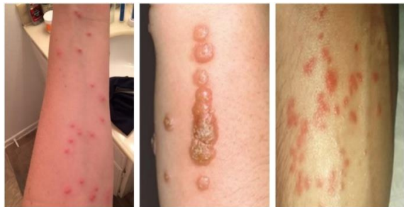
شکل-۴. واکنش بدن میزبان با حساسیت‌های مختلف به گزش ساس (۳۹، ۵۰)

در کودکان گزارش شده است (۴۵، ۴۶). اصطلاح Cimicosis، در واقع به گزش‌های ایجاد شده توسط ساس اطلاق می‌گردد. بزاق این حشره در هنگام خون‌خواری باعث ایجاد تحریک و خارش شدید در میزبان گردیده و به دنبال آن، راش‌های پوستی و حساسیت را به وجود می‌آورد (شکل-۴). این حشره علاوه بر ایجاد خارش و تورم در پوست میزبان، باعث ایجاد برخی از مشکلات روانی از قبیل اضطراب، رفتارهای اجتنابی، بی‌خوابی، کابوس، حساسیت بیش از حد به وجود حشره و همچنین اختلال در عملکردهای شخص می‌گردد و در موارد پیشرفته، به ترس توهمی از حشرات (انتموفوبیا) یا توهم آلودگی به انگل (Delusional parasitosis) منجر می‌شود. ایجاد بوی بد در مکان‌های ساس زده نیز می‌تواند از مشکلات بهداشتی این حشره محسوب گردد (۴۷، ۴۸). نتایج بررسی تعدادی از بیمارانی که دارای ضایعات پوستی روی بدنشان بودند در کشور اسلواکی، نشان داد که از ۶۲ بیمار بالغ، ۵۷ نفر (۹۱/۹ درصد) ضایعات روی بدنشان به خاطر گزیدگی ساس تختخواب، C. lectularius بوده و یک نفر (۱/۷ درصد) به علت گزش ساس، گونه Oeciacus hirundinis بوده است. از این ۵۷ نفر، در ۳ نفر کم‌خونی یا فقر آهن، ۶ نفر تنگی نفس و در ۱۰ نفر حساسیت شدید به گزش حشره مشاهده شد (۴۹).